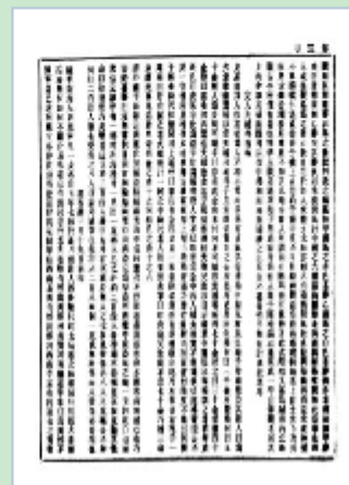
1872.04.30 第 3 版